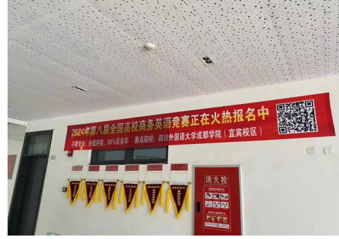
四川外国语大学成都学院 (宜宾校区)