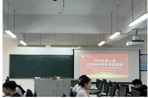
天津财经大学珠江学院