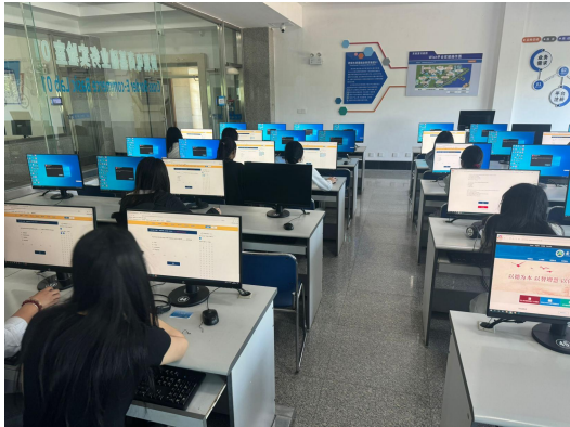
辽宁对外经贸学院