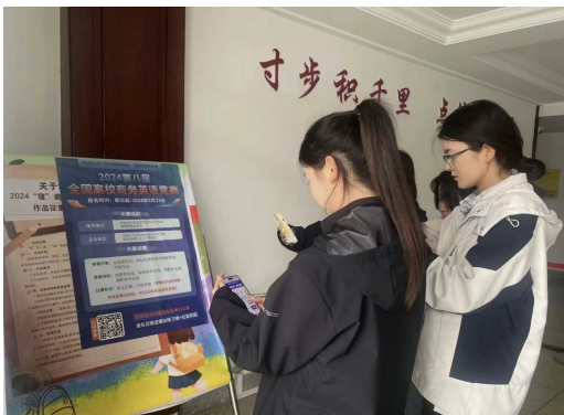
辽宁对外经贸学院